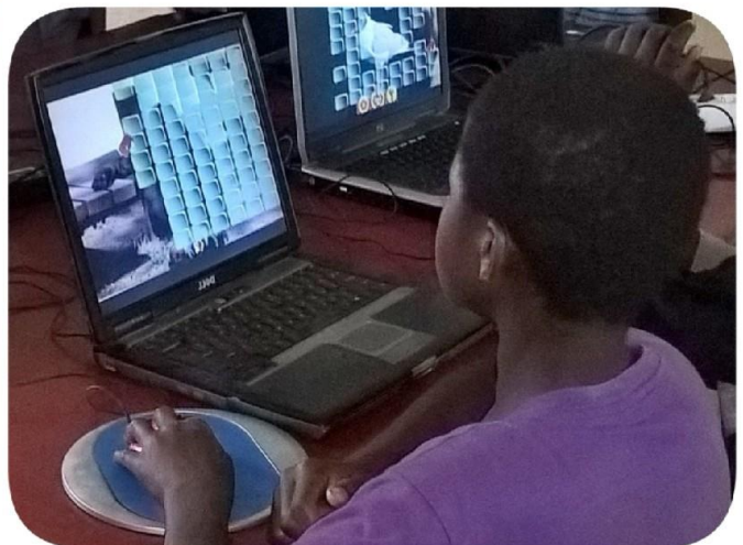
Computerles voor basisschoolleerlingen